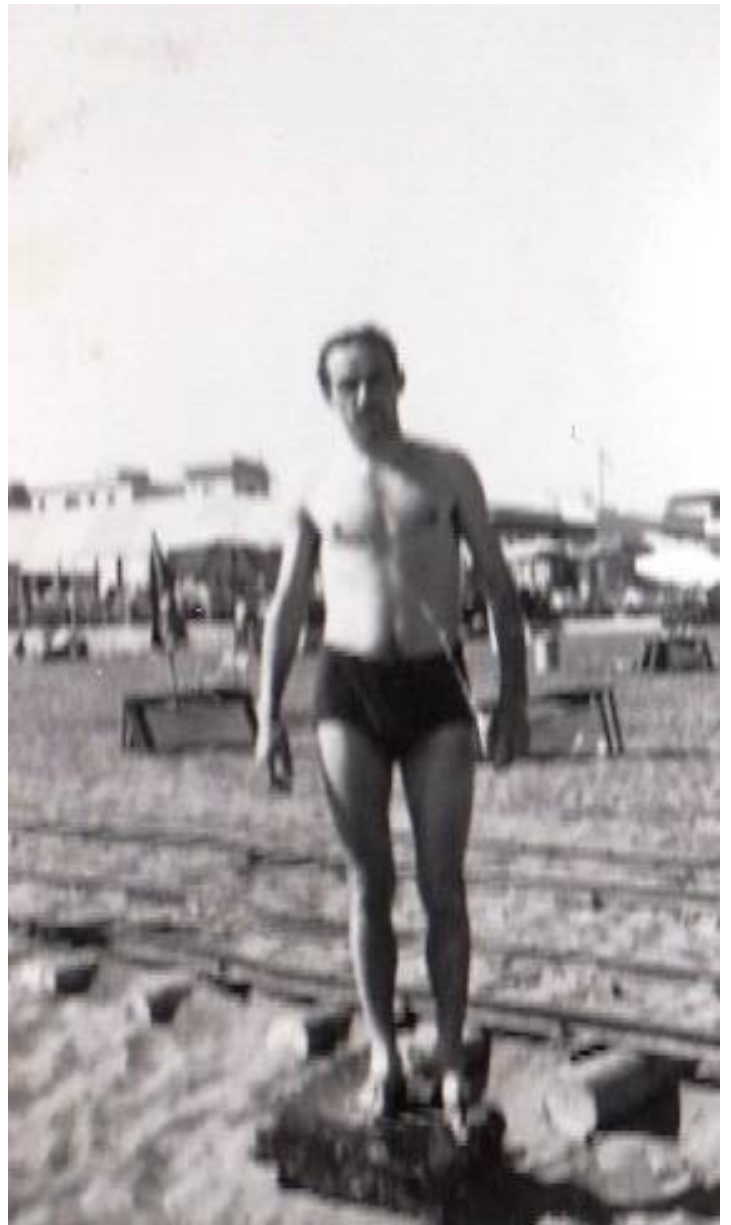
Ausgang im Anzug und Krawatte bei der Engelsburg und am Strand.