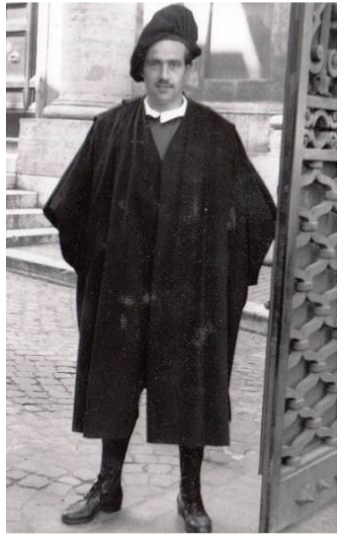
Dienst bei der Porta Sant'Anna.