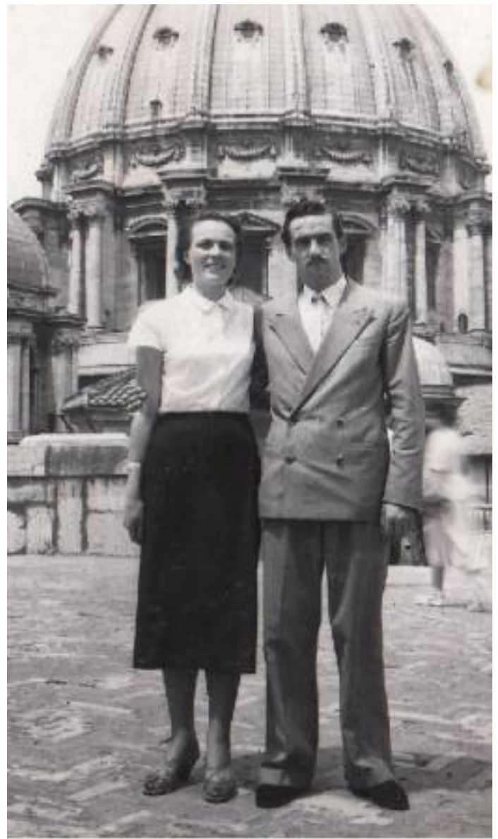
Dienst in Castel Gandolfo und Besuch von seiner Schwester.