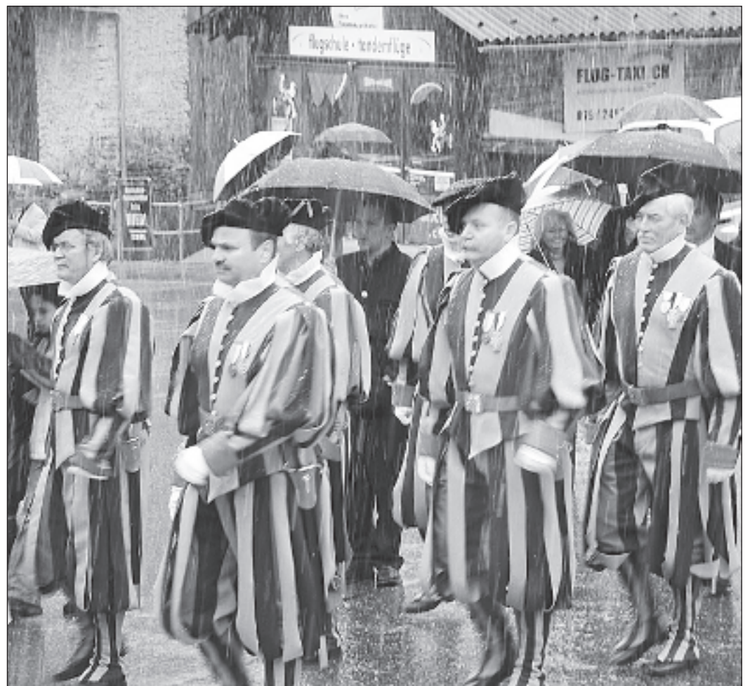
Die Gardisten trotzten bei ihrem Umzug auch dem Schneefall.